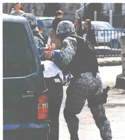
Ljubušaci pozorno pratili privođenje osumnjičenog

duljilo pritvor zbog opasnosti od bijega, ali i zbog velikog straha svjedoka, posebno onih koje tek treba saslušati. Inače, za organizirani kriminal i međunarodni promet drogom minimalna predviđena kazna je pet godina zatvora, ali se može izreći i 10 ili više.