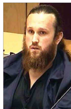
Ikanović vojni zapovjednik IS-a

gumosna agencija (OSA) o svojim saznanjima godinama upozorava i obavještava nadležne. Prije tri godine direktor OSA Almir Džuvo je upozorio Parlament BiH i javnost kako u BiH djeluje oko tri hiljade vehabija i da su zbog svojih radikalnih protudržavnih stavova, posjedovanja oružja, pa i terorističkih napada najozbiljnija prijetnja miru i opstanku države. On je tada naveo da su u svakom trenutku spremni na terorističke akcije, uz naznaku da OSA o tome ima precizne podatke i dokaze. Po njegovim riječima, panika i strah uhvatili bi svakog građanina kada bi znao na što su sve spremne