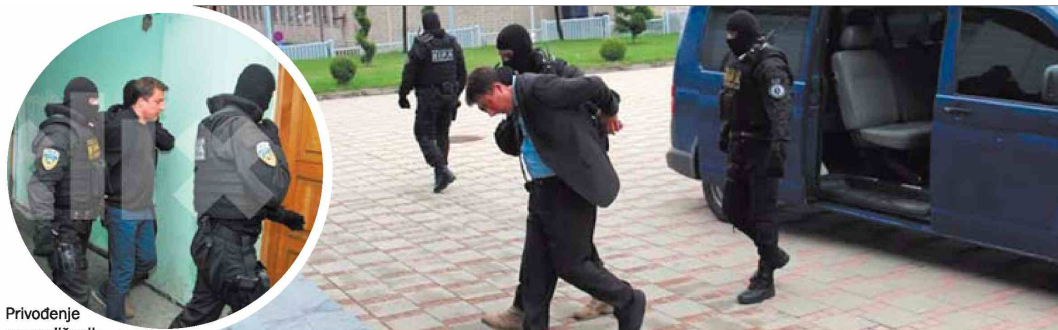
Privođenje osumnjičenih