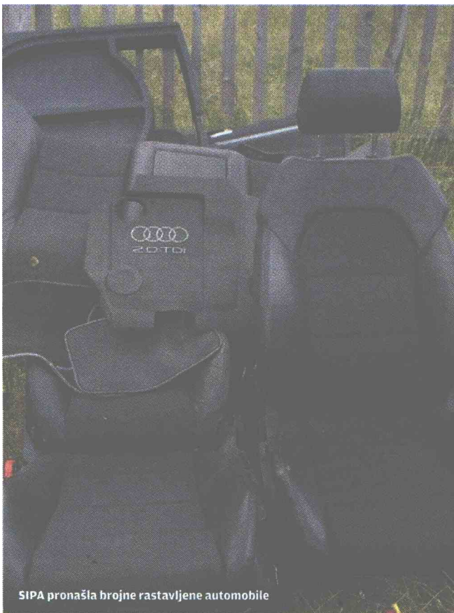
SIPA pronašla brojne rastavljene automobile