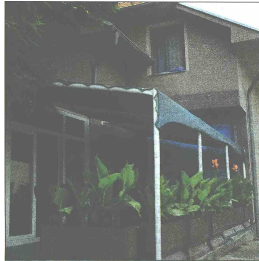
U Bijeljini izvršen pretres u kafiću "Akvarijus"

U Bijeljini su pretresi jučer ujutro rađeni u ulicama 27. mart, Dušana Radovića, Braće Gavrić, Ilije Garašanića te u Filipa Višnjica na izlazu prema Tuzli, gdje je pretresen kafić "Akvarijus".