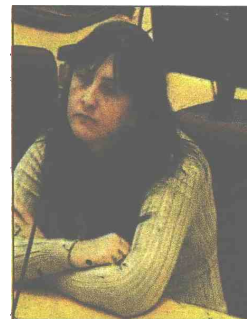
Coker: Priznala krivicu

Inače, zbog blizine granice sa Srbijom i Hrvatskom Bijeljina se u bosanskohercegovačkim okvirima smatra raskrscicom puteva droge. Općepoznata je "propusno-