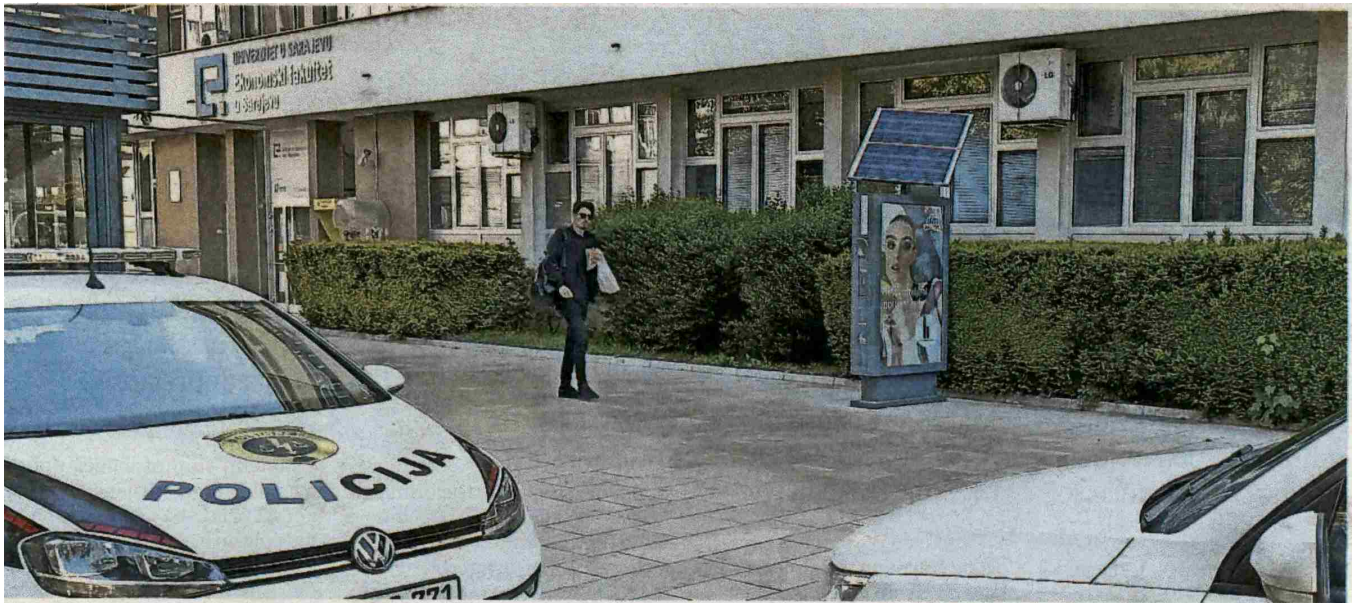
Pretres i porostorija Ekonomskog fakulteta UNSA / DIDIER TORCHE