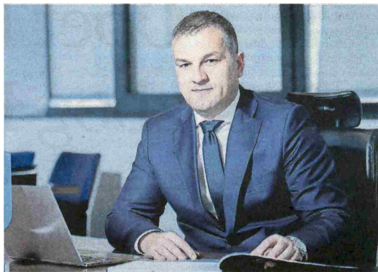
Uzunoviću je u januaru Sud BiH ukinuo pritvor u sklopu druge istrage

posto dionica Bosnalijeka. Piše i da je Mehmed Jahić godinama bio angažiran u Bosnalijeku kao savjetnik i primao je, u prosjeku, između 15 i 20 hiljada maraka mjesečno. Dobi- jeni novac je, potom, prebacivao na račune supruge i sina. Oni su, potom, kupovali dionice Bosnalijeka.