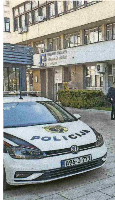
Pretres je obavljen i u prostorijama sar-

Konjičani za Uzunovića kažu da, “ako je kriv, do sada je sakrio šta je imao” i dodaju da “njegova familija, koja nije ništa imala, sada vozi dobre aute”