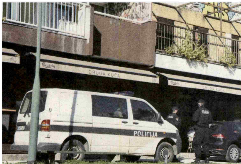
Sarajevo: Pretresene prostorije „Otvorene mreže“

- Batko je ispričao sve ono što mu je poznato o navodima za koje ga terete. Mora se imati u vidu da je on uspješno organizirao 70 transplantacija, a da se u ovom slučaju radi o pet nezadovoljnih ljudi. Recimo jedan od njih je naveo da je predugo čekao na transplantaciju bubrega, a za to se i u Americi zna čekati po pet godina. Mi kao odbrana tražili smo da ide u kućni