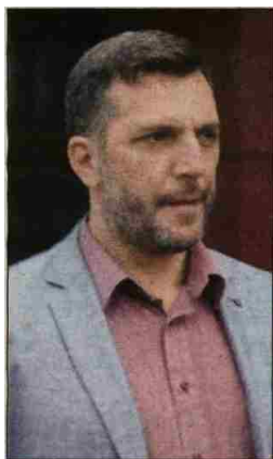
Zolak: Dao sve dozvole

firma koja je u vlasništvu TV voditelja Fikreta Hodžića. U ovoj aferi za sada su osumnjičeni Fadil Novalić, premijer FBiH, Fahrudin Solak, direktor Federalne uprave civilne zaštite (FUCZ), i Fikret Hodžić.