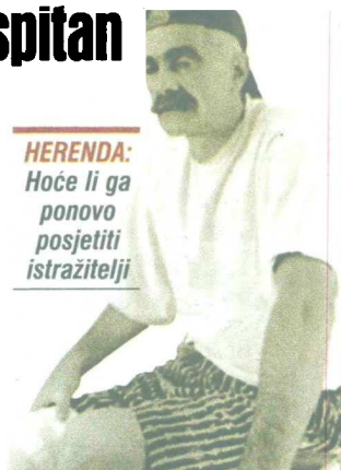
HERENDA: Hoće li ga ponovo posjetiti istražitelji

To je jedan od razloga zašto bi SIPA , po nalogu Tužilaštva BiH, putem međunarodne pravne pomoći mogla ponovo ispitati Herendu, ali isključivo o slučaju „Ugljen“.