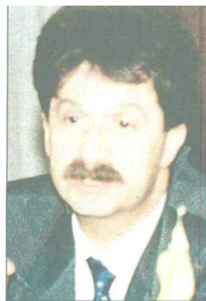
Ugljen: Likvidiran 1996. godine

Tako SIPA , kako nezvanično saznajemo, saslušava