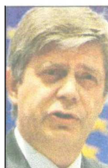
Vigemark: Kažnjiva prijetnja

- Slavljenje ratnih zločina ili genocida u suprotnosti je s vrijedno-