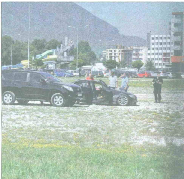
Na Ilidži 2016. godine pucali u policajce