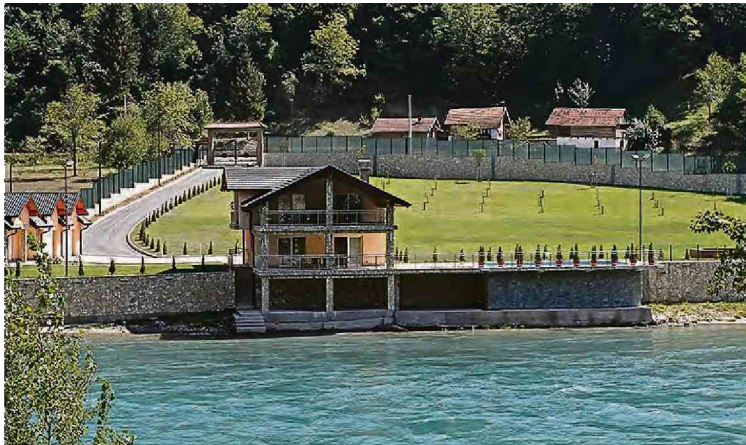
Radeljaševo imanje u Ustikolini