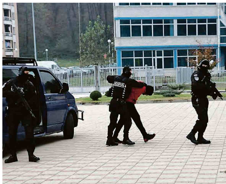
Hapšenje osumnjičenih u akcijama Twins i Pismo

Djevojke koje su pokušale izaći iz ovog lanca prostitucije bile su izložene prijetnjama, psihičkom i fizičkom zlostavljanju