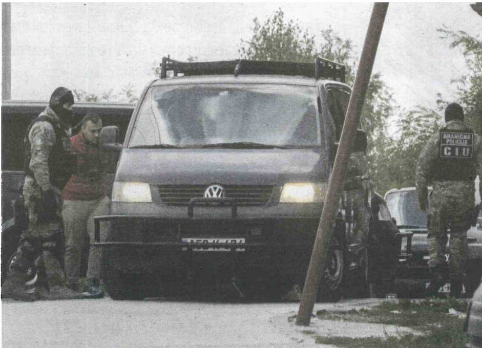
SIPA upala na Goricu u srijedu