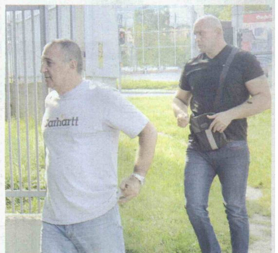
AZIM KAJEVIĆ I MARKO KRAJIŠNIK