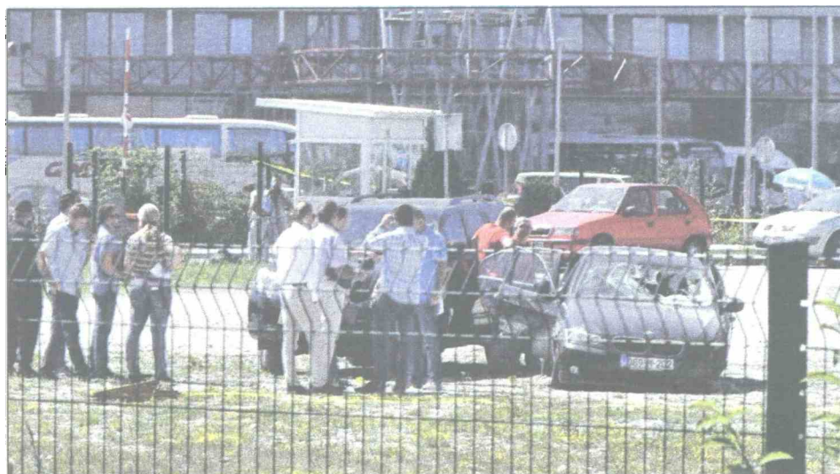
Detalj s uviđaja na Butmirskoj cesti

menski period, prema operativnim i obavještajnim saznanjima, djeluje u Sarajevu i BiH.