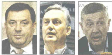
Dodik, Lagumdžija i Radmanović: Poznanstva i veze

Macana su, prema nalogu Tužilaštva BiH, uhapsili pripadnici SIPA-e, koji su u potrazi za dokazima pretresli njegovo imanje u selu Prijakovci, kao i stan u Gundulićevoj 74 u Banjoj Luci, gdje je i uhapšen i sproveden u prostorije SIPA-e na daljnju kriminalističku obradu. - Bivši direktor ID-DEEA-e osumnjičen je za zloupotrebu položaja i nezakonitosti u procesu izbora preduzeća