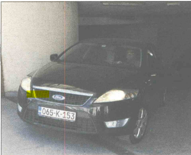
Banja Luka: Injac odvoze iz Agencije za bankarstvo RS