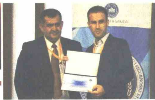
Zahvalnice i partnerstva

nijeg izvođenja nastavnog procesa i njegovog povezivanja s praksom i radom iz prakse. Naravno, menadžment CEPS-a i u narednom periodu će nastaviti s realizacijom ovog projekta.