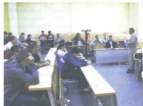
Stručna znanja za studente

Radi stjecanja stručnih znanja za studente i nastavnike Visoke škole „CEPS – Centar za poslovne studije“,