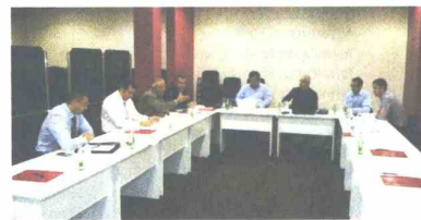
Projekt „Obrazovanje protiv korupcije“