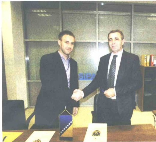
Sporazum sa SIPA-om