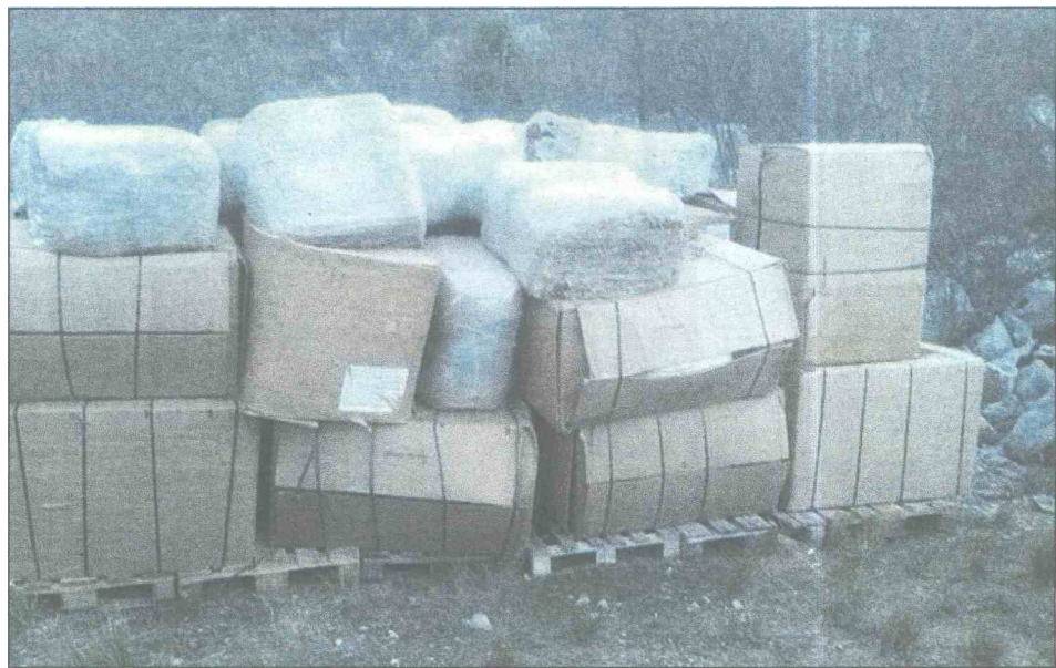
SIPA duhan pronašla u kartonskim kutijama

Aktivnosti na terenu realizirane su u saradnji s pripadnicima Ministarstva unutrašnjih poslova Zapadnohercegovačkog kantona i službenicima Uprave za indirektno oporezivanje BiH.