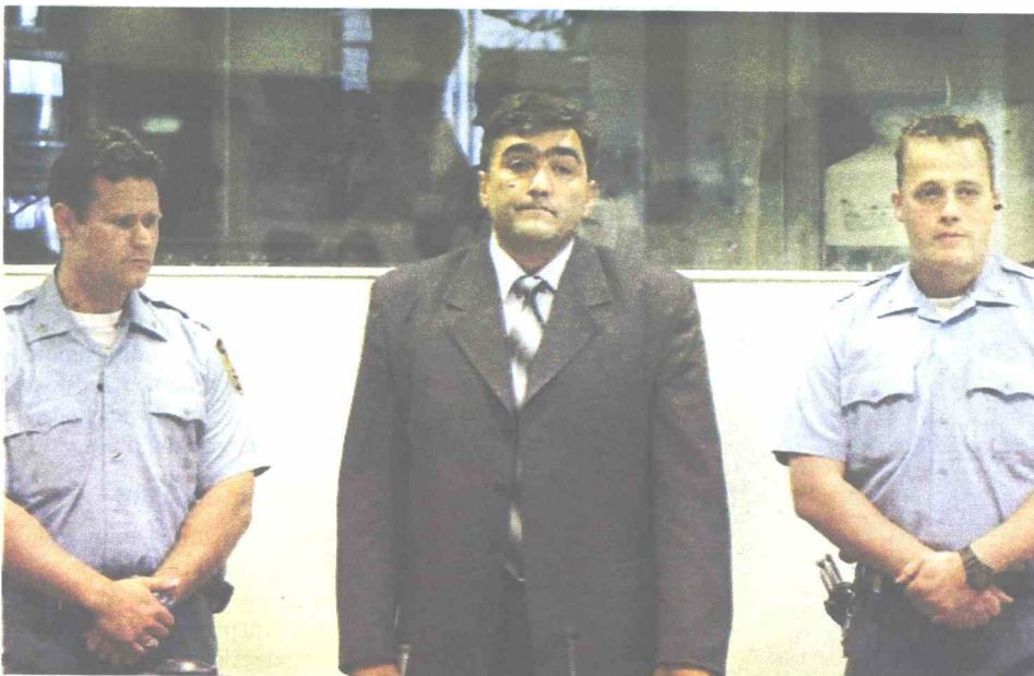
Mrđa u Haškom tribunalu