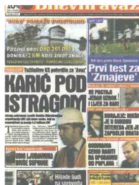
„Avaz“ još u maju 2014. godine objavio vijest o pokretanju istrage