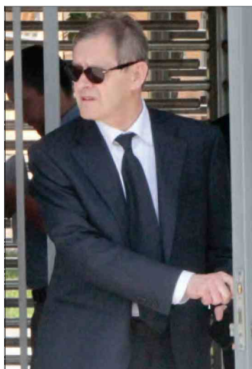
Ibrišimović: Očekujem da moj branjenik bude pušten

- Ovo je stanje koje nas sve vodi u propast. Da će doći kraj i prestanak hapšenja, teško je očekivati. Još će i djecu šehida početi hapsiti zbog nekakvih uloga u ratu. Najžalosnije je što se radi o Tužilaštvu BiH, koje nosi takav naziv, ali ne djeluje tako, kazao je Patković, te najavio sastanke u narednom periodu na kojima će nosioci ratnih priznanja gledati da uhapšenim generalima na bilo koji način pomognu.