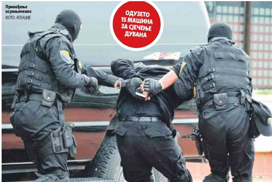
Привођење осумњичених

ПИШЕ: НЕВОЈША ТОМАШЕВИЋ ntomasevic@glassrpske.com