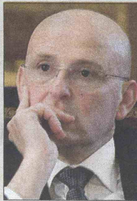
Đani: Boravio u Sarajevu

Iz KTA su nakon prethodnog sastanka šefa delegacije zaduženog za sigurnost iz Vatikana, predstavnika Katoličke crkve u BiH te sigurnosnih agencija istakli da ne postoji prijetnja papi