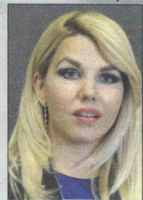
Jozić: Prosljediti informacije

tnje za papu Franju. Delegacija koja je dolazila u Sarajevo vrlo je zadovoljna si-